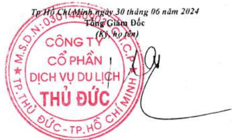
Đào Đức Cang