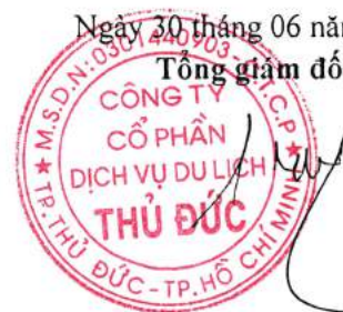
Đào Đức Cang